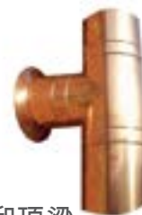
铜-不锈钢-铜制作的管道和顶梁