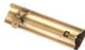
黄铜-钢制作的碳刷架