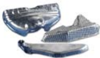
铝-钢制作的隔热罩