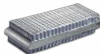
铝-钢制作的空冷式冷凝器(DACC)