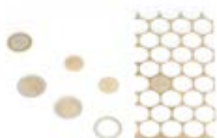
CuNi25-Nickel-CuNi25 /CuZn25Si 制作的1欧元和2欧元硬币